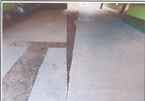
Foto 2: Corredor principal del centro educativo con algunos daños por las caídas de agua debido al canal en mal estado.