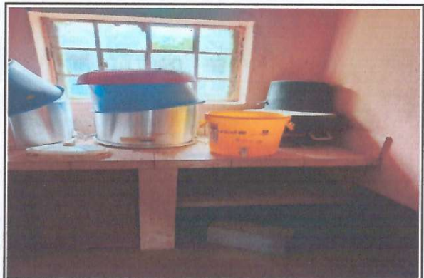
Foto 4: Espacios de la cocina del establecimiento para mejoras y optimizar espacio dentro de la misma.

Observación: Si es necesario se pueden agregar hojas adicionales y actualizar el número de hojas.