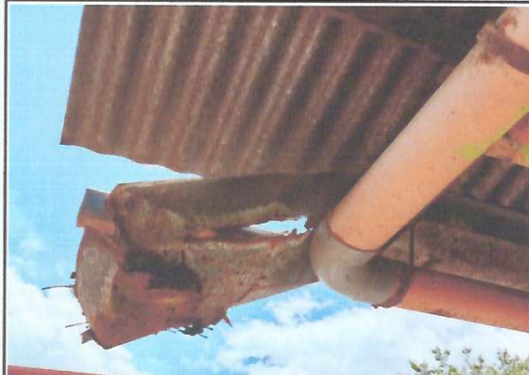
Foto 1: Canal del centro educativo en malas condiciones y con goteras, lo que hace que durante las lluvias en el corredor caiga bastante agua.