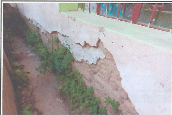
Foto 3: Daños en el repello y paredes de un módulo de aulas y cocina debido a que son de adobe.